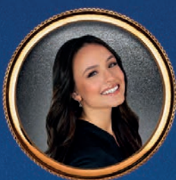
LARISSA MANOELA Liesl